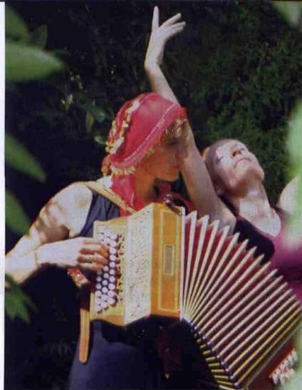
Femmes troubadours "Azala"